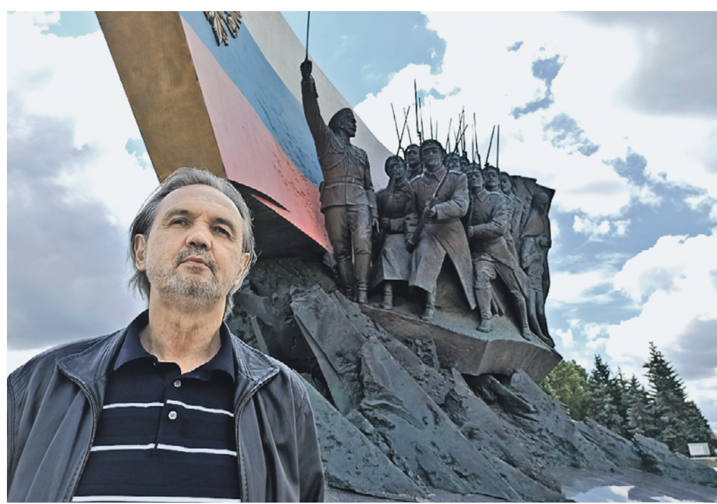
30 июля. Автор памятника героям Первой мировой войны на Поклонной горе в Москве (на заднем плане), народный художник РФ, председатель правления Союза художников России Андрей Ковальчук.

Открытие памятника в 2014 году было приурочено к столетию с момента начала войны. Одна из драматических страниц нашей истории была уже знакома скульптору, народному художнику РФ, председателю правления Союза художников России Андрею Ковальчуку. — До этого я работал над памятниками членам императорской семьи и больше полугода мои интересы и мысли были связаны с этим временем: читал различные источники, среди которых были прежде недоступные мне материалы, — поделился скульптор. — Сохранилось желание глубже погрузиться в эти события и развернувшиеся на фоне войны исторические катаклизмы. В проектировании памятника окружающее пространство сыграло очень важную роль. — Место сложное, но с идеологической точки зрения выбрано правильно, — рассказал Андрей Ковальчук. — Там находится монумент Победы, рядом Триумфальные ворота, посвященные победе в Отечественной войне 1812 года. Монумент героям Первой мировой установлен между ними на своеобразной оси: такое решение усиливает историческую и духовную связь боевых подвигов народа. Памятник состоит из трех основных частей, рассказал скульптор. — Доминанта всей композиции — скульптура русского солдата, установленная на высокой колонне. Я показал уже не молодого солдата, георгиевского кавалера, прошагавшего по суровым дорогам войны. Стремился создать собирательный образ русского воина, с чьей выполняющей свой долг, — сказал Андрей Ковальчук. — Самым крупным смыс-