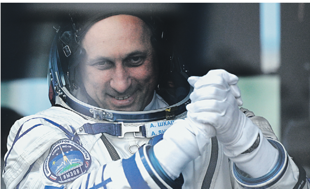
5 октября 2021 года. Член основного экипажа 66-й экспедиции на Международную космическую станцию космонавт Антон Шкаплеров перед стартом космического корабля «Союз МС-19» на космодроме Байконур

фильма. В этот момент я осознал, насколько огромную работу провернула съемочная группа в космосе.