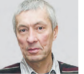
ЮРИЙ КОЗЛОВ ПИСАТЕЛЬ, ГЛАВНЫЙ РЕДАКТОР «РОМАН-ГАЗЕТЫ»