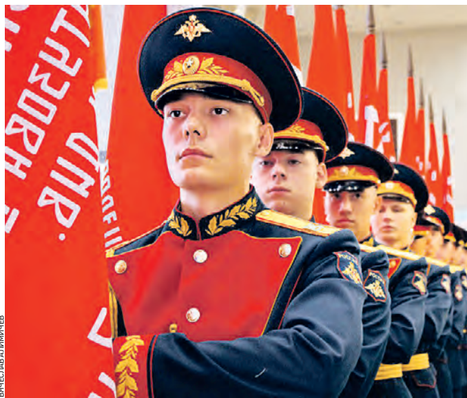
1 мая. Военнослужащий Семеновского полка несет знамя для передачи представителям военных округов (флотов)